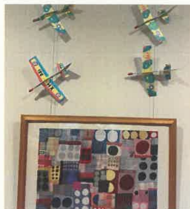
廊下にこんなものを飾っています。

雑巾を作成して下さり有難う御座います。皆さんが心をこめて作成した雑巾は入居者の為に使用させていただきます。何時かお会いできる日が来ましたら是非遊びに来てください。 スタッフ一同