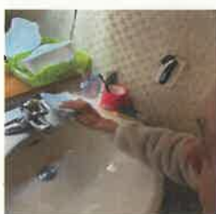
部屋の洗面台を拭いています

雑巾を作成して下さり有難う御座います。皆さんが心をこめて作成した雑巾は入居者の為に使用させていただきます。何時かお会いできる日が来ましたら是非遊びに来てください。 スタッフ一同