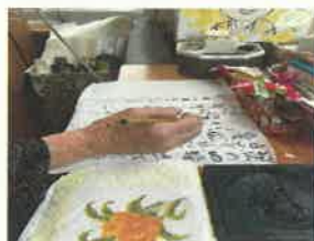
お習字の先生をしていました。 大切に使います